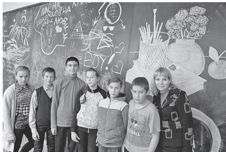
Доска во всю стену коридора — «изюминка» Перелучской школы