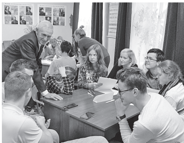
Леонид Быков с участниками семинара