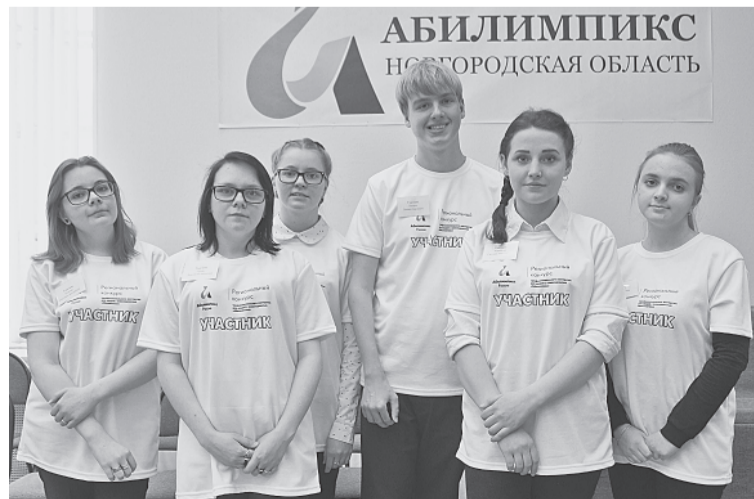
Боровичская команда «Абилимпикса»

мое место, оборудованное всем необходимым — набором ниток мулине из 550 цветов, набором вышивальных игл, лупой-лампой... Несколько минут на инструктаж, знакомство с рабочим местом, получение конкурсного задания — и работа «закипела». За 1,5 часа ребятам нужно было